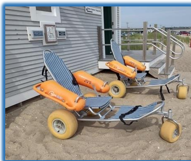
Exemple de fauteuil