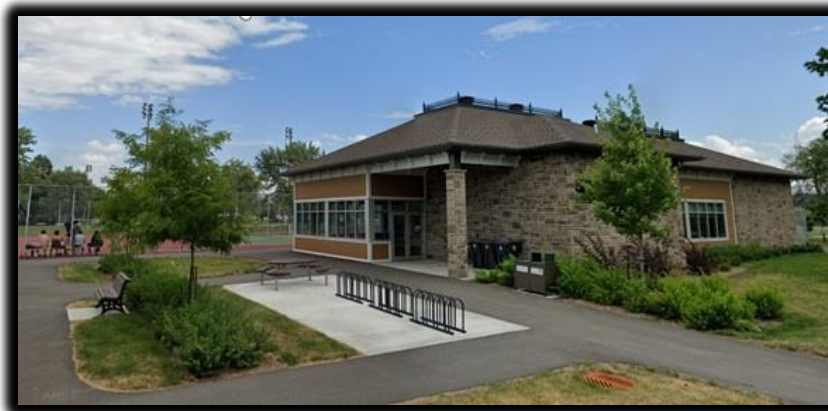
Chalet du parc Sunnybrooke