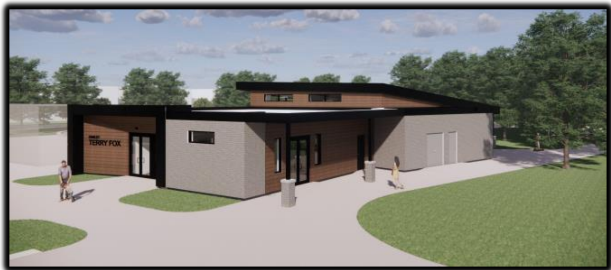
Chalet du parc Terry-Fox